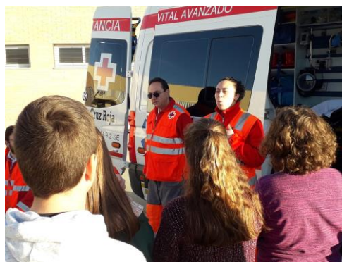
Charla en centro escolar

El equipo humano de Cruz Roja Española son profesionales expertos en la atención a emergencias tanto individuales como colectivas y estará formado por: