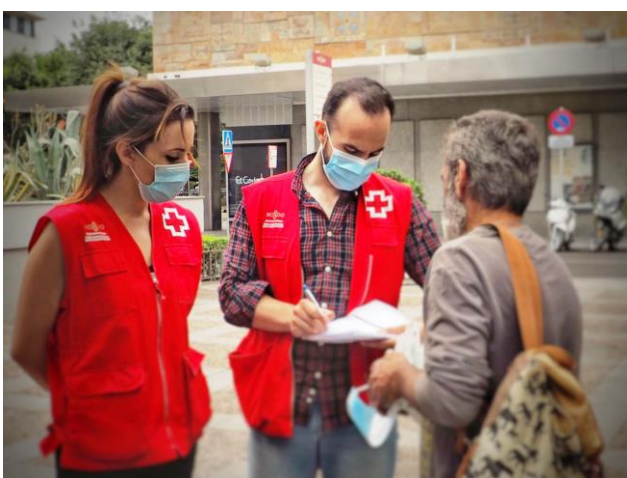
Equipo UES atiende a personas sin hogar

Unidad Movil de Emergencia Social (UES). Proyecto de intervención directa en calle, a través de equipos de voluntariado principalmente, que realizan rutas de calle para la localización de las personas en situación de calle, así como información y orientación sobre los recursos, derivaciones y acompañamientos, además de proveerles de productos básicos de alimentación, higiene y abrigo para cubrir sus necesidades básicas.