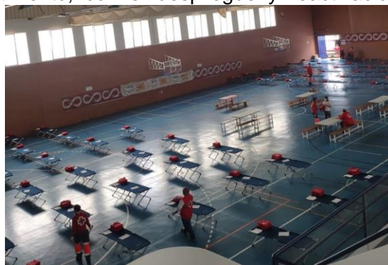
Ejercicio de adiestramiento