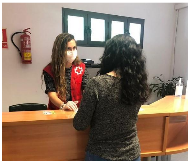
Entrega de tarjetas monedero

El Proyecto “tarjetas monedero” tiene por objetivo la cobertura de algunas de las necesidades básicas, en concreto de alimentación, higiene personal y del hogar, de personas y unidades de convivencia, que se encuentran en situaciones de vulnerabilidad y dificultad económica y social.