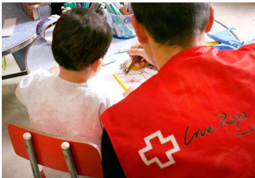
Ocio en aula hospital

69 niños y niñas se divierten por las tardes con el voluntariado de Cruz Roja.