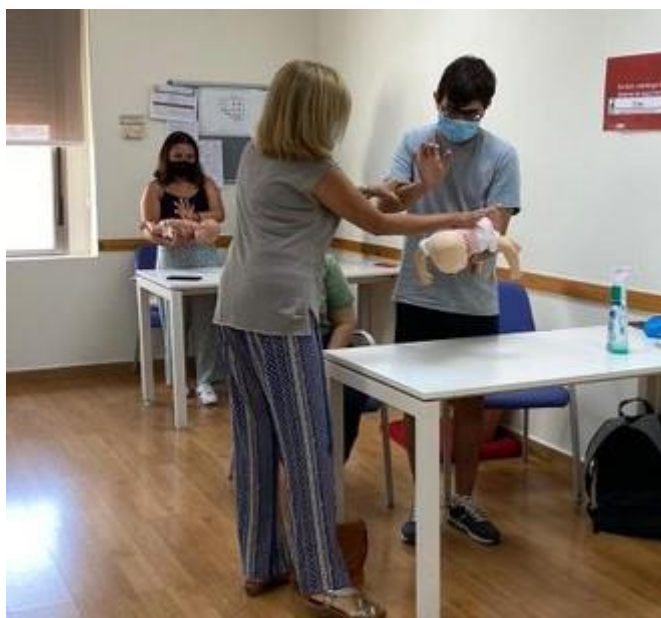
Clase de Primeros Auxilios en bebés y niños