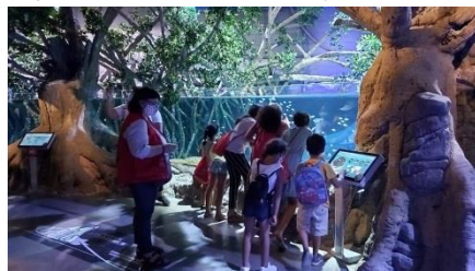
Visita Acuario de Sevilla

Actividades culturales y de ocio durante el mes de julio, este año adaptado a la metodología Covid. Todas las intervenciones se han realizado en espacios exteriores públicos de interés de la ciudad de Sevilla. Trabajando ejes transversales como las habilidades sociales, el bienestar emocional, la promoción de los tics y la igualdad de oportunidades de los niñas y niños.