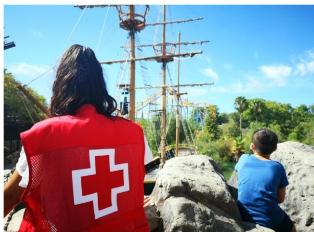
Salida de ocio a Isla Mágica

Se trata de un programa con el objetivo último de empoderar a las familias en dificultad para que ejerzan sus funciones parentales y fomenten el desarrollo integral de los niños, niñas y adolescentes a su cargo en igualdad de oportunidades.