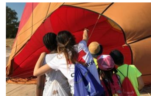
Paseo en globo