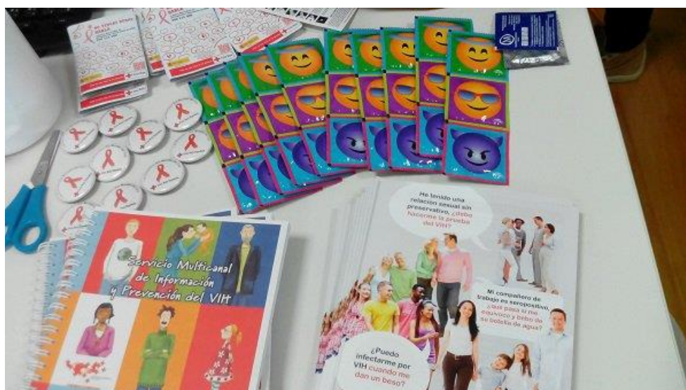
Material taller prevención de VIH

Es un proyecto de intervención comunitaria integral cuyo objetivo es prestar apoyo social, psicológico y sanitario a las personas que viven con VIH; para favorecer la adherencia al tratamiento, la permanencia en su entorno, la integración social, la reinserción laboral y la prevención de situaciones de crisis. Para ello, se lleva a cabo un trabajo directo con las personas a través de una atención individual integral y del desarrollo de itinerarios personalizados que tengan en cuenta no sólo su estado de salud, sino también otras condiciones sociales que les afectan. Las acciones individuales se complementan con otras grupales y con acciones de sensibilización en su entorno.