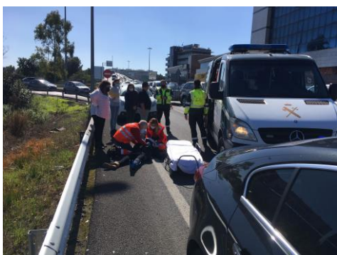
Intervención en accidente de tráfico

Dentro del acuerdo con el 112, disponemos de diferentes recursos para poder atender a múltiples víctimas en caso de desastres naturales o accidentes con múltiples víctimas.