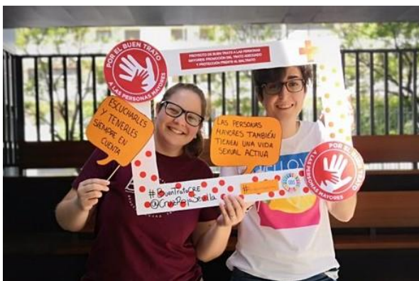
Actividad de sensibilización en Universidad de Sevilla

Este proyecto está dirigido a evitar que las personas mayores en situación de especial vulnerabilidad, puedan convertirse en víctimas de malos tratos, así como a que las personas mayores que hayan sido o estén siendo víctimas de un maltrato en cualquiera de sus formas puedan salir de esta situación recuperando así su calidad de vida, sea a través del cese de la situación de maltrato y/o a través de la superación de las secuelas producidas por el mismo. La intervención se dirigirá a todas las tipologías de maltrato, desde la violencia física, económica o psicológica, a otras formas menos evidentes como la vulneración de derechos o el maltrato social desde dos esferas de atención: la intervención proactiva con las personas mayores que reúnen circunstancias que les hacen especialmente vulnerables y la atención y apoyo a las personas mayores que están sufriendo o han sufrido episodios de malos tratos para que puedan superar esta situación y no vuelva a suceder.