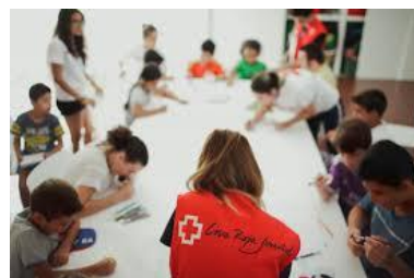
Clase de apoyo escolar

A través del proyecto Promoción del Éxito Escolar se provee apoyo escolar, refuerzo educativo, entrega de meriendas en concepto de refuerzo de la alimentación y otras entregas de bien relacionadas con el ámbito académico a niños y niñas en entornos sociofamiliares de riesgo. Promoviendo el desarrollo personal y las habilidades sociales a través del ocio.