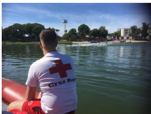
Preventivo en río Guadalquivir