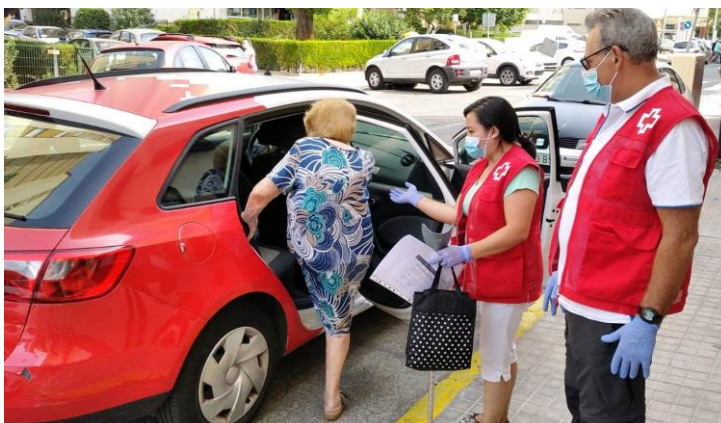
Traslado y acompañamiento al médico

A través de las diversas actividades que contempla, se facilita acompañamiento en el domicilio con el objetivo de reducir el sentimiento de soledad de la persona mayor o de realizar gestiones que la persona no puede hacer por sí sola (ir a una cita médica, llevar a cabo un trámite administrativo o dar un paseo), así como acciones encaminadas a fomentar la participación social y comunitaria.