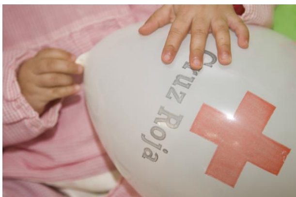
Actividad lúdica con los menores

El Centro Infantil ‘La Mía’ es un centro destinado a conseguir el desarrollo integral de los niños y de las niñas en su primera infancia (0-3 años).