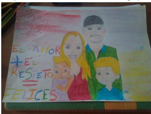
Concurso de dibujos para los menores

Intervención destinada a mujeres víctimas de violencia de género, así como a sus hijos e hijas menores a través de sesiones grupales. Como objetivos, se trabaja por un lado