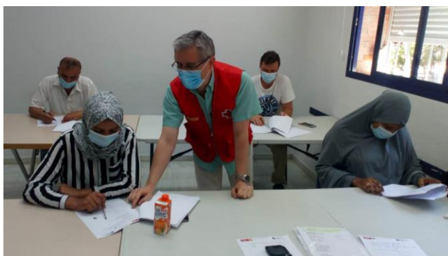
Clases de Español

El programa de Acogida de Protección Internacional es el conjunto de servicios que desde Cruz Roja se presta a aquellas personas extranjeras que solicitan asilo en nuestro País. Son personas provenientes de todos los continentes que huyen de la violencia existente contra ellos, lo que los lleva a escapar de sus países para sobrevivir. Desde nuestra entidad, nuestro equipo compuesto por personal laboral y voluntariado, realiza una gran variedad de actividades con ellos: búsqueda de alojamiento, ayudas de manutención, farmacia, vestuario, apoyo psicológico, educativo, enseñanza de la lengua española, asesoramiento jurídico, búsqueda de empleo, ... Todo ello para lograr una plena integración en la sociedad de acogida que les permita volver a tener un hogar y un futuro en el que vivir.