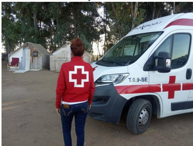
Atención en asentamientos

Programa para la realización de actuaciones dirigidas a mejorar las condiciones de vida de las personas inmigrantes instaladas en asentamientos chabolistas. Su objetivo es aliviar la situación de vulnerabilidad, de las personas inmigrantes que viven de manera continua o temporal en asentamientos, a través de la mejora de las condiciones de vida y mediante el desarrollo de oportunidades de inclusión con el acceso a recursos, incidiendo en los factores de vulnerabilidad que les afectan.