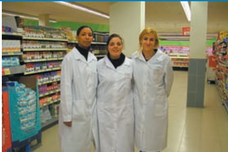
Participantes del Plan de Empleo, en su puesto de prácticas en un supermercado Eroski de Verín.

Cruz Roja de Galicia ofertó el año pasado 282 cursos externos, abiertos a la población general, en sus sedes de las cuatro provincias. Destacan entre ellos, tanto por el número de cursos celebrados, como por la continua demanda existente, los de primeros auxilios en sus distintas modalidades, seguidos de los cursos del área social, como los de cuidados dirigidos a personas mayores. Todos los miembros de Cruz Roja, voluntarios y socios, se benefician de un 10% de descuento en estas actividades formativas.