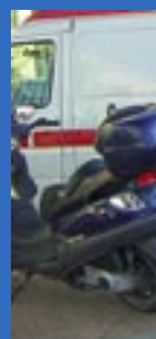
Los diez comp

Tanto el stand como las ponencias asturianas “tuvieron mucha aceptación y, por ejemplo, por el operativo de Cangas del Nancea, se recibieron muchas felicitaciones”, explica aún impresionada por el ambiente de “una sala llena en la que se abordaban temas de gran importancia como los riesgos medioambientales, a los que dan tanta importancia en el resto de España, como por ejemplo, los problemas derivados de la falta de agua, a los que aquí no valoramos en toda su magnitud”, afirma.