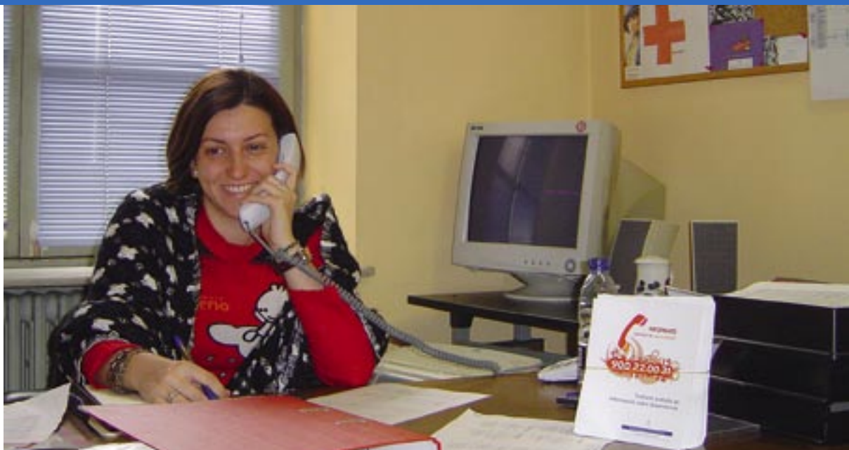
El teléfono, de carácter gratuito, recibió en su primer mes de funcionamiento alrededor de 500 llamadas.