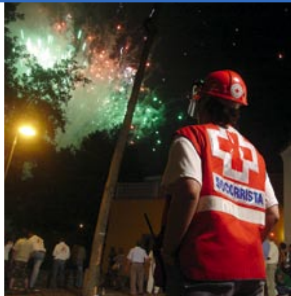
Uno de los más destacados proyectos asturianos fue el Preventivo Especial montado con motivo de las fiestas del Carmen y la Magdalena, la tr... voluntarios y ambulancias del resto del territorio nacional.