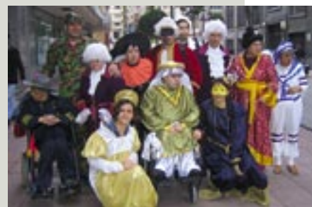
El proyecto con discapacitados de Oviedo.

A propuesta del Comité Autonómico de Cruz Roja en el Principado de Asturias se