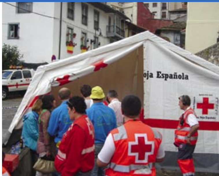
tradicional 'descarga' de Cangas del Narcea, que reúne a todos los efectivos locales y además a