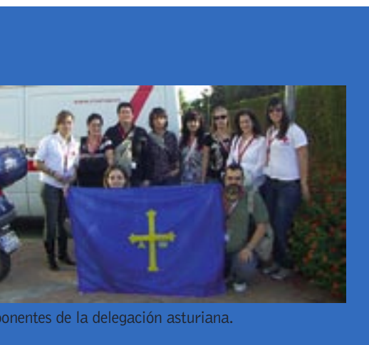
ponentes de la delegación asturiana.

El recurso facilita información desde los/las jóvenes para los/las jóvenes en la franja horaria de las tardes sobre los temas que más interesan a los/las jóvenes. Es un trabajo creado por jóvenes y para jóvenes "de igual a igual" y se trata de una actividad que está abierta a toda la información que pueda necesitar alguien de esta edad.