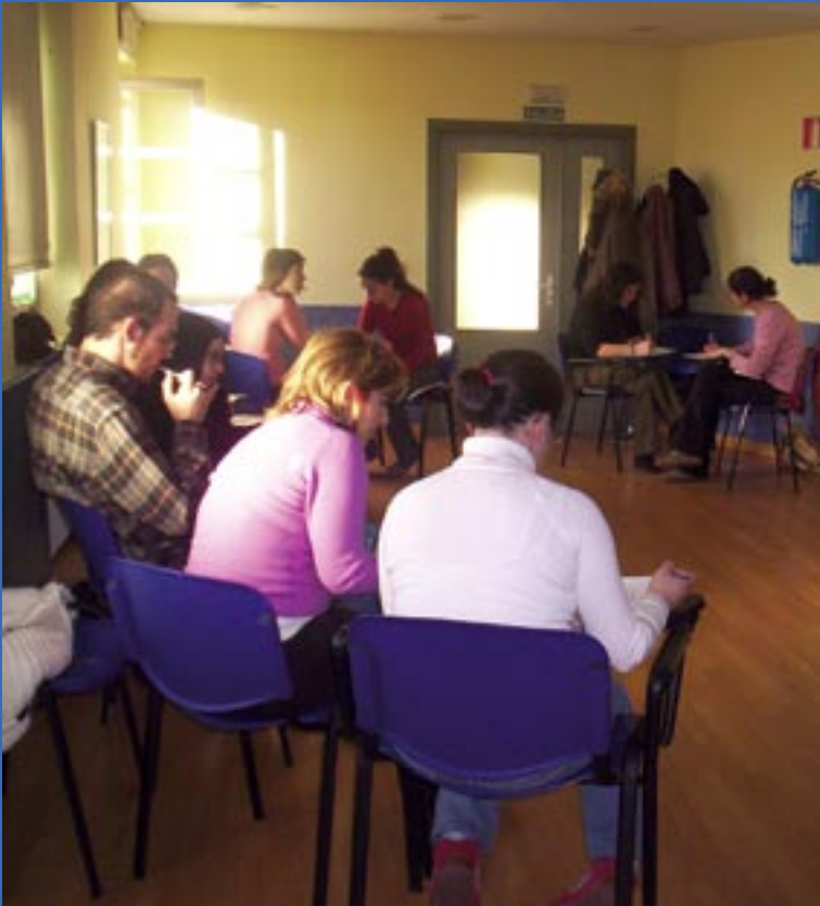
La realidad de Sierra Leona fue uno de los temas para la reflexión durante este curso.