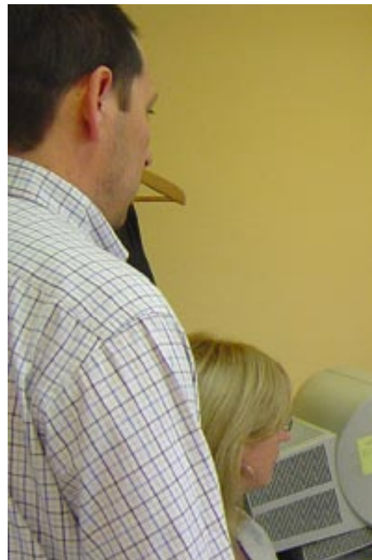
Entre los acompañamientos más solicitados figuran los s...